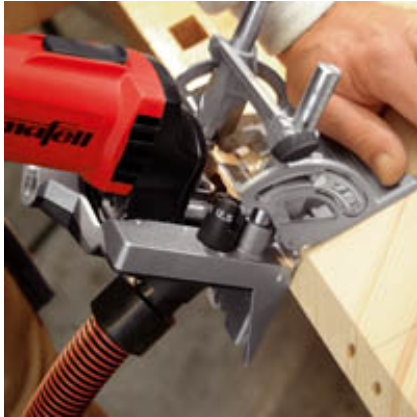
Schnell und exakt: Eckverbindung stumpf oder auf Gehrung.