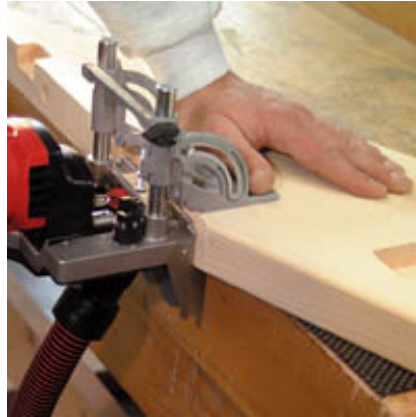
Arbeiten beim Treppenbau, in der Werkstatt oder auf Montageeinsätzen.