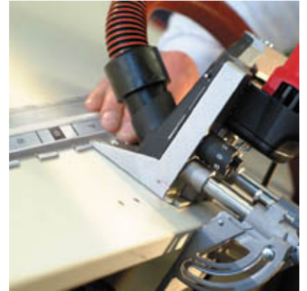
Schnell und günstig: Korpusherstellung mit dem DD40 und Dübel-Lehre.