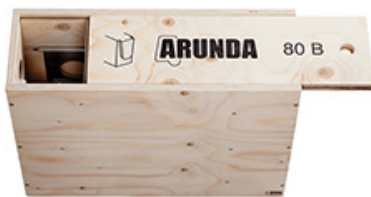
Das Arunda-System wird in einer praktischen Holzbox geliefert.