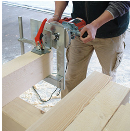
Schnelligkeit: 8 bis 18 Verbindungen pro Stunde (Zapfen +Einschnitt).