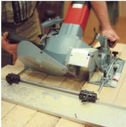
Die ZK 115 Ec mit der Führungsschiene.