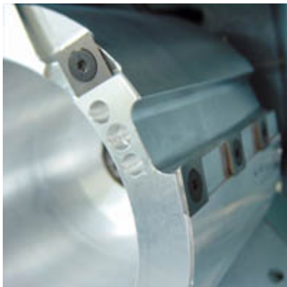
Der neue Fräskopf mit seinen Hartmetall-Wendeplatten für extreme Zerspanung bei optimalem Spänefluss.