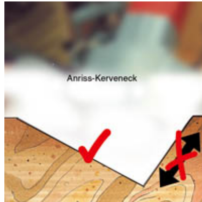
Unübertroffen präzise - bewährte rechtwinklige Höhenverstellung. Kervenabstände sind auch bei Holztoleranzen immer konstant.