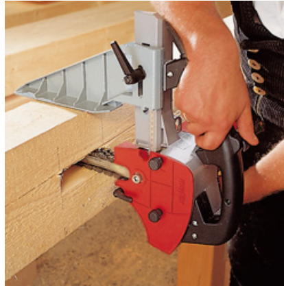
Der LS 103 Ec in horizontalem Arbeitseinsatz.