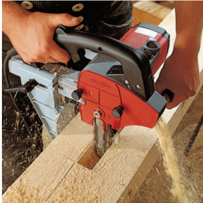
Zapfenlöcher mit dem LS 103 Ec in verschiedenen Abmessungen bis 100 mm.