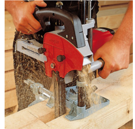
Der LS 103 Ec mit dem Führungsgestell FG 150 für Stemmtiefen bis 140 mm.